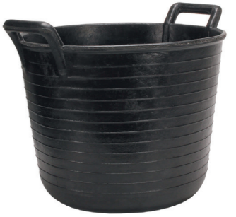
ESPUERTA RUBBER BASKET N°99 (33 l) REF.88804