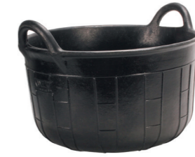
CARBONERA RUBBER BASKET N°2 (30 l) REF.88902