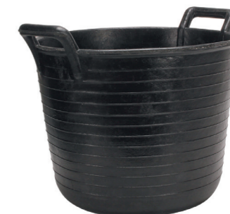
ESPUERTA RUBBER BASKET N°99 (33 l) REF.88804