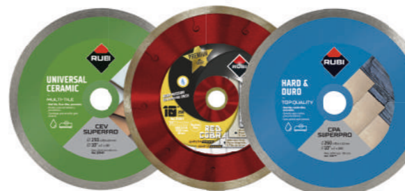
Ref. 30949 Ref. 30961 Ref. 30929